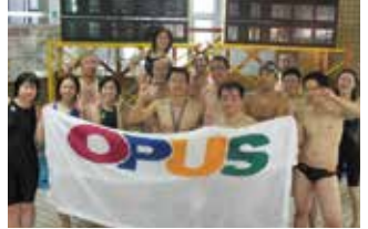
25M泳げる方ならご参加頂けます！みんなで楽しく、レッツスイム！