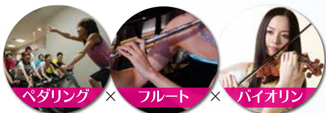
ペダリング × フルート × バイオリン

白田コーチや浦コーチが指揮者のような服装で躍動して皆様をリードする様は、まるで本物の指揮者のようでした!