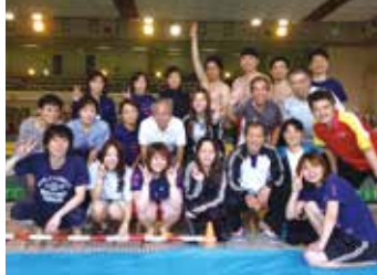
参加者全員で記念撮影。過去最多の参加人数で大賑わいでした！