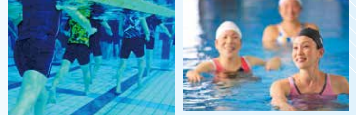
水の抵抗を利用した運動は効果抜群! 運動はやっぱり楽しいもの! みんなで楽しみながら、カラダを動かそう!

開催日 9月7日(月)10日(木) 11:15~11:45/21:15~21:45 場所 オーパス2Fプール 料金 無料(規定外利用料は頂きません) ※プール利用が出来ない方もこの日はOK!