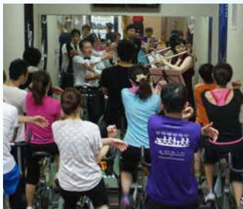
ペダリング×フルート(高岡店の様子)