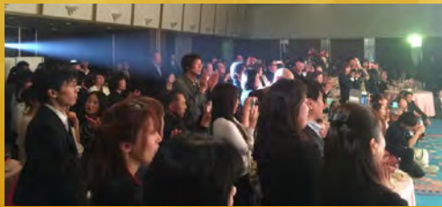
さすがものまねのチャンピオン! 笑いで会場は大盛り上がり!