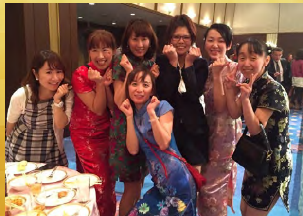
各テーブルも大盛り上がり! 楽しいパーティーとなりました