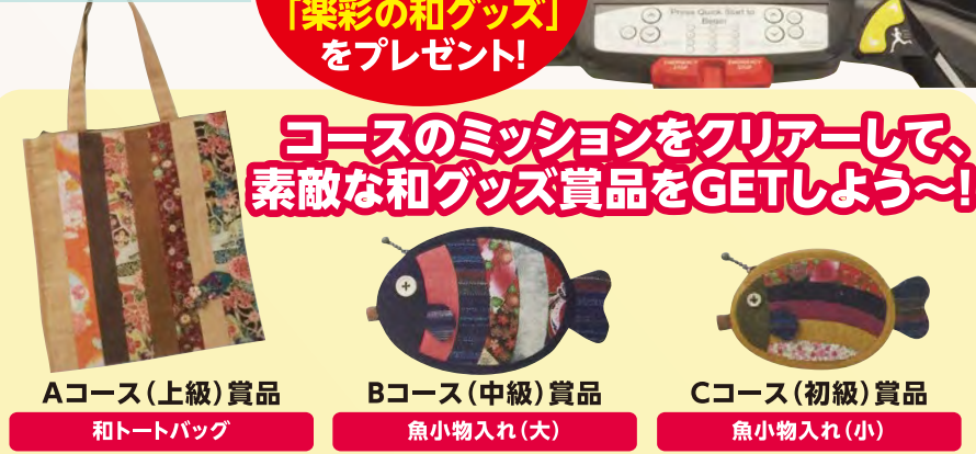
Aコース(上級)賞品 和トートバッグ