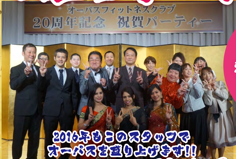
オーパスフィットネスクラブ 20周年記念 祝賀パーティー