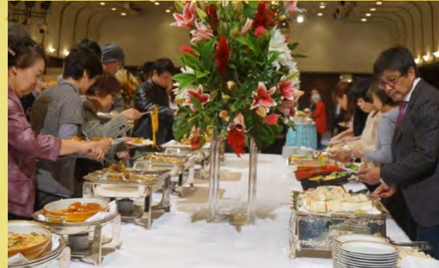
ビュッフェスタイルの食べ放題でしたが、常にステージが盛り 上がっていたため、食べられていない方が多くいらっしゃった ので、特別に30分時間を延長して、沢山食べて頂きました。