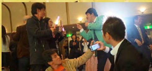
ステージから降りてのサービス 皆さん、大興奮でした!