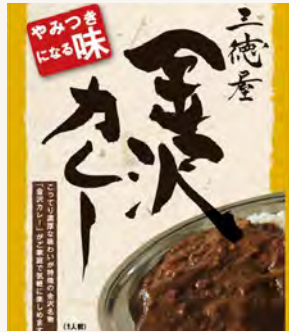
金沢→富山 累計100km達成

申込用紙に必要事項をご記入の上、料金を添えてフロントにて申し込みください。ペダリング、グループライドも対象に入ります。