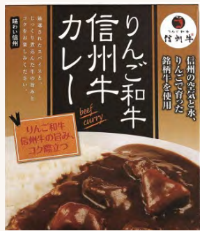
長野→東京 累計450km達成