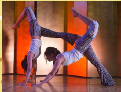
ヨガスタジオoBiから、インド人で世界チャンピオン 講師たちによるベアヨガを披露してくれました。