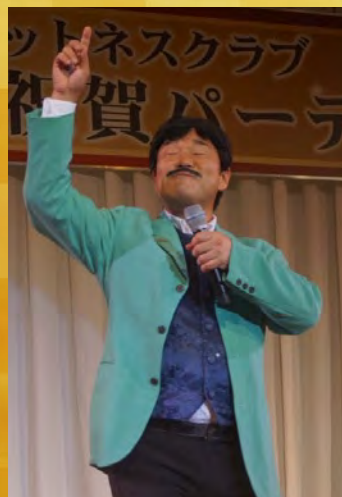
トリを飾った特別ゲストノブ&フッキーの ものまねジェットコースターは 抱腹絶倒 のライブでした!