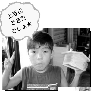
上手に できま せよ★