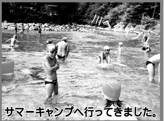
サマーキャンプへ行ってきました。