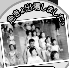
エンジョイエアロ部門