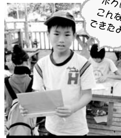
ボクは、 こんなの できたよ★