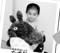
おすすみしゅう 大鷲笹くん ジャンボトロロもゲット★