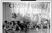
最後はみんなでハイ!ポーズ