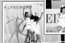
ハート&エンジェルズ