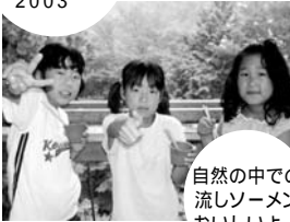
自然の中で 流しソーメン おいしいよ