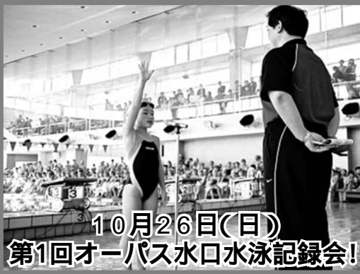
10月26日(日) 第1回オーパス水口水泳記録会!

オーパス水口初の 友人・家族 紹介キャンペーン 開催 9/20(土)~11/29(土)