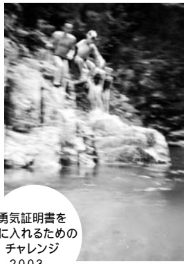
勇気証明書を 手に入れるための チャレンジ 2003

バーベキューは自分たちで火を起し、焼きそばを作ったり、串焼きを焼いたりしました。みんなで協力しあい出来上がった夕食は、すごくおいしかったです!おなかいっぱい食べました。