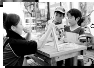
ここは、 どうあるの?