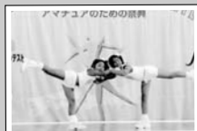
スマイルガールズ