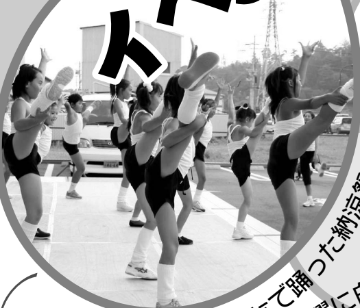
みんなで踊った納涼祭