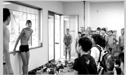
昨年、夏の鈴鹿合宿にて全国中学出場のため、合宿途中で遠征出発。仲間みんなでそうこう会を行った時のひとこま

つの日か巣立ち社会に旅立っても会社の上司を変えてくれと訴えるのでしょうか。通常は子供より親の方が先に死を迎えます。いつまでも子供を守る事は出来ないはず。いつの日か一人社会で生き抜くため、突き放す事も子供のために必要ではないでしょうか。