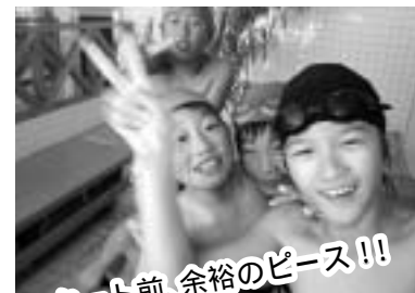
スタート前、余裕のピース!!