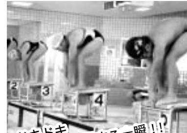
ドキドキ とっても緊張する一瞬!!!