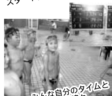
みんな自分のタイムと順位に興味津々