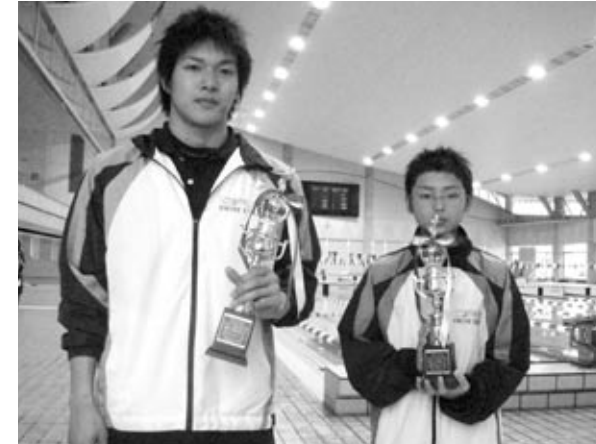
A級富山県大会優秀選手賞 オーバスより2名が選ばれました!

つい先日北陸A級大会が行われました。富山、石川、福井から北陸のトップ選手たち35チームが参加。総勢495名のA級以上の選手が地元富山市民プールで競い合いました。