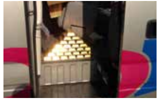
バスの扉が開くと黄金の延べ棒! サプライズ大成功!