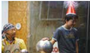
サイエンスショーで静電気の実験帽子が爆発している~(笑)

53名の生徒が集まった高岡店の春のバスツアー。今回は福井県の児童科学館エンゼルランドと越前松島水族館へ行ってきました。エンゼルランドでは、まずサイエンスショーを見学。空気を電気などのたくさんの科学実験に生徒達も驚きがいっぱいのような様子でした。スペースシアタールームでは映画ドラえもんプラネタリウムを見学。最新のドーム映像は大迫力でした。展望台で絶景を楽しみながら昼食をとった後は、屋内遊具・屋外広場での自由時間。天気にも恵まれ、みんな気持ちよさそうに遊んでいました。特に屋外にある巨大トランポリンが人気で、みんな汗いっぱいかいてもおかないし!おはしやぎの科学館でした(笑)。越前松島水族館では、ペンギンのお散歩やイルカショー、サメやエイを触ったりして海の世界を楽しみました♪なんと、ダイオウイカも展示してあり、その迫力にみんな驚いていました!お土産のショッピングも楽しみ、あっという間のバスツアーとなりました。帰りのバス内も興奮冷めぬ様子で、終始笑い声で一杯の車内でした。