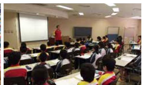
合宿最後はミーティングで締めくくります。夏に向けて頑張ってくださいね