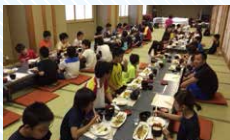
速くたくさん食べるのも競技者には必要なのです。

小学2年生から高校3年生までの、高岡(33名)・水口(19名)の合計49名の選手たちが参加し、毎年恒例の春の高岡合宿を行いました。毎年、この時期に開催する合宿は晴天にも恵まれ、今年も絶好の合宿日和となってくれました。普段、なかなか会うことのない水口と高岡の選手たちにとってはお互いに良い刺激となり、いつも以上に気合のこもった練習ができたのではないのでしょうか。今回、初めて合宿に参加した新選手たちも、いつもとは違う練習の雰囲気や参加人数に圧倒されていましたが、徐々に仲間と打ち解け、お互いに切磋琢磨しながら練習に励んでいました。そして、毎年新選手達を練習以上に苦しめるのが食事です。5日間の練習量を支えるだけの食事を摂らなければなりません。目の前に出される大盛りのご飯やおかずを目を丸くしながら黙々と食べる新選手達。泳ぐだけでなく、食べることも大事な練習なのだと感じ取ってくれたのではないのでしょうか。そして、5日間の長い合宿練習を乗り越え、最終日にどれだけ練習で自信がついたのかを試す記録会を行います。新選手は200M個人メドレー、それ以外の選手は400M個人メドレーを泳ぎます。合宿に参加したすべての選手が大変良い泳ぎで合宿を締めくくってくれました。また、初めて合宿に参加した新選手も5日間で力強くなった泳ぎを見せてくれました。学年が上がるにつれ、ベストタイムを出すのが難しくなる中で、ほとんどの選手がベストタイム、もしくはそれに近いタイムで泳ぎ切ってくれたことは、取りも直さず5日間の練習が良かったことの裏付けと言えるでしょう。そして同じ目標を持った仲間たちと過ごした5日間は、彼らにとって良い経験になったに違いありません。8月に東京で開催される、ジュニアスイマーの最高峰の大会であるジュニアオリンピック出場まであともう少しという選手が数名居たことも、チーム全体の雰囲気も良く、選手自ら追い込んだ練習ができていたのではないのでしょうか。今シーズンこの合宿の成果をいかに発揮し、夏のシーズンに大きな成果が得られるようコーチ一同願っています。