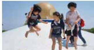
巨大トランポリンではしゃく生徒たち終始笑い声がやみませんでした