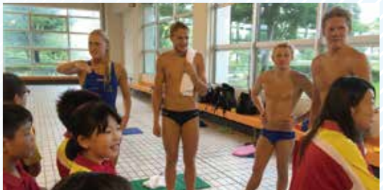
間近で会う代表選手に喜ぶオーパスの選手たち