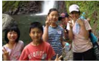
滝から吹いてくる風が気持ちいい! みんな癒されています!