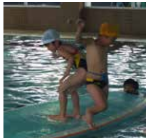
女の子だって負けられない! 一瞬のタイミングが勝負を分けるお尻相撲!