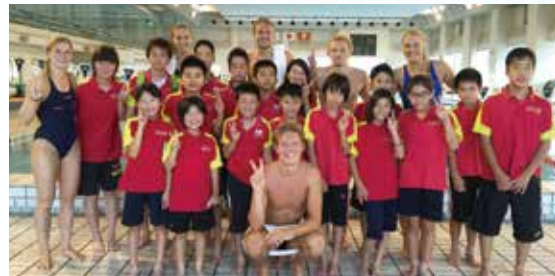
スウェーデンユニバーシアード代表選手との記念撮影

平成27年6月27日(土)富山県総合体育センター室内プールにスウェーデンユニバーシアード代表チームが韓国で開催されるユニバーシアード世界大会の調整合宿地として、富山県に来県していました。 世界レベルの泳ぎを間近で見られるチャンスとあって、希望者を集めて見学してまいりました。 ユニバーシアード世界大会前の調整とあって、残念ながら軽めの調整の泳ぎしか見れませんが、泳ぎのきれいさ、水をかきわけて進む推進力、スタートの浮き上がる位置など、一流の泳ぎにみんな目を奪われていました。 最後に記念撮影と握手を快くして頂き、オーパスの選手たちにとって大変良い思い出になったことと思います。