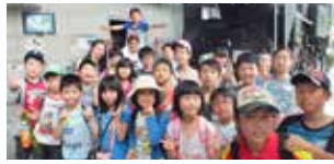
科学館を歩き回り、いろんな体験ができました!

水口店のバスツアーは大自然溢れる岐阜県養老町と大垣市に行ってきました。まず最初に向かった大垣市科学博物館では施設内をポイントラリーをしながら巡り、いろんな科学の体験をしてきました。大きな施設を1時間程歩き回り、朝一番で良い運動になったのではないのでしょうか。そして次に向かったのは今回のバスツアーの目玉となる養老町にある「養老天命反転地」です。有名なデザイナーが設計した不思議なパビリオンがいくつもある公園で遊んだ後は、少し離れた場所にある「養老の滝」に向かいました。800Mもの急な坂道を頑張って登り切り、養老の滝を目の前にした生徒達は滝の迫力に歓声を上げ泳ぎに行こうとする生徒までいたほどです。半日動き回った疲れが吹っ飛ばす程に滝の周辺は涼しく風もあり、本当に癒されました。最後にバスに乗り込む前に、今日一日大いに動き回った生徒達に黄金に輝く金の延べ棒のプレゼントがありました。夕陽に照らされて輝く金の延べ棒に生徒達はびっくり!コーチ達からのサプライズプレゼント大成功でした!来年のバスツアーも是非参加して下さいね!