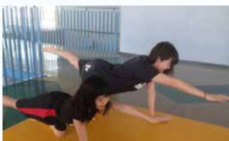
柔軟な体、強い体幹を作るためにヨガを取り入れました。懸命に泳ぐ新選手たち。毎日約10km泳ぎこみました。新選手にヨガの指導中!