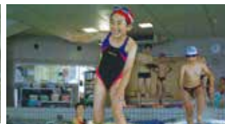
白熱の水上ダッシュ! 水の上を走るの、難しいけど、面白い!