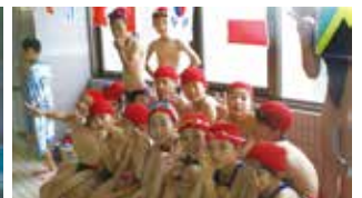
接戦の末優勝したのは赤団。おめでとう!