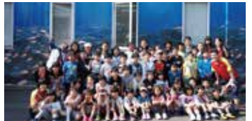
水族館前で、全員で記念撮影 思い出ができたね!