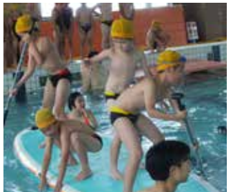
「ぶつかるぶつかる!」みんなで声を出しあって前に進め!「民族大移動レース」