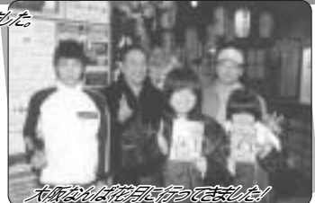
大阪にはお盆に行っていました!

2月9日(土)~20日(日)の2日間、大阪の東大阪アリーナにおいて、関西からの競泳選手99名が集い、行われました。オーバースからは各の選手がエントリーし、今大会初デビューしました。この大会は小学生から大学生まで同時に競い合う無差別の大会であり、参加した選手にとって自分の本調子によっては「関西強豪勢はあじろか、願わば入賞チャンスか?」と、本番での出場でしたので、選手たちも意気揚々と大会に臨みました。しかし、結果的にはお盆まで進出を果すことができませんでした。シーズン中の大きな大会におけるエディンブルグや遠征時の疲れの払拭法、あるいは本番大会への調整法など、コーチの私自案、また選手たち自身においてなど、さまざまな課題が浮き彫りになった大会となりました。 「この大会の悔しさを忘れず、今夏精一杯開花できるまで...」と皆で誓い合いました。 -高野コーチ PS. そしてなつと大阪にも行きました... 下記の記録は大会当時の学年です。